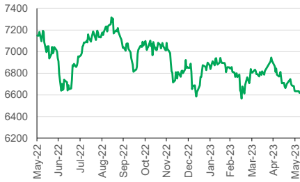
IHSG (YoY) 1D +0.01%