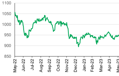
LQ45 (YoY) 1D -0.14%