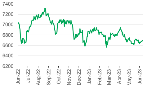
IHSG (YoY) 1D +0.56%