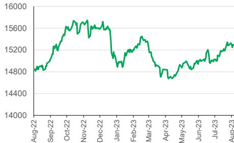
USD/IDR (YoY) 1D -0.08%