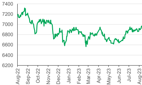
IHSG (YoY) 1D +0.35%