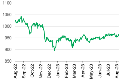
LQ45 (YoY) 1D +0.49%