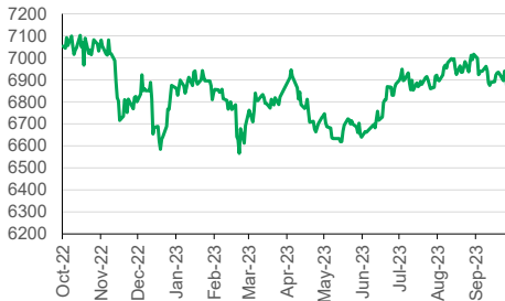
IHSG (YoY) 1D +0.04%