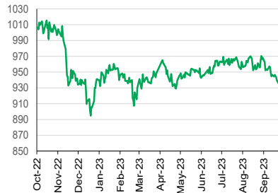
LQ45 (YoY) 1D +0.20%