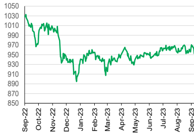
LQ45 (YoY) 1D -0.07%