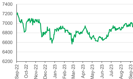
IHSG (YoY) 1D +0.03%